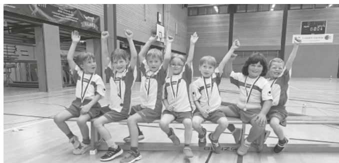
Auch in der neuen Handballsaison hatten unsere kleinsten Handballer wieder viel Spaß.

Alle weiteren Infos gibt's auf unserer Homepage.