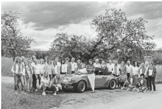
HeartChor Ingerkingen