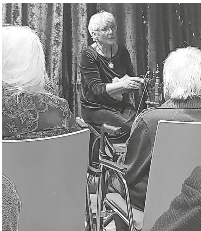
Momentaufnahme aus der Märchenstunde

„Und so lebten sie glücklich und zufrieden...“ und bekamen in diesen zauberhaften Tagen herzliche Erinnerungen in den Garten ihrer Phantasie gepflanzt!