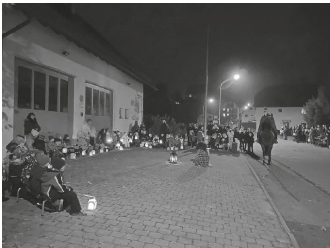
St. Martinsfeier Kita Alberweiler

Am Montag 11.11.24 feierten wir mit unseren Familien das St. Martinsfest. Begonnen haben wir mit einem gemeinsamen Lied. Die Aufregung legte sich sehr schnell als die blauen und gelben Punkte angefangen haben ihren Tanz aufzuführen. Anschließend zeigten die roten und grünen Punkte ihren eingeübten Tanz. Hierzu ein großes Lob an alle Kinder, die voller Vorfreude beim üben und auch trotz der Dunkelheit super mitgemacht haben. Nach den Tänzen haben wir gemeinsam das traditionelle St. Martinslied (St. Martin ritt durch Schnee und Wind) gesungen. Und schon kam unser St. Martin angeritten der dem armen Bettler eine Hälfte des warmen Mantels gegeben hat.