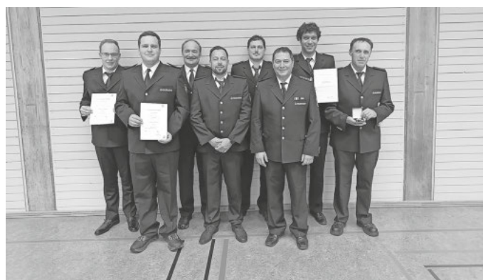
Alle Geehrten und Beförderten