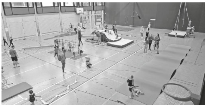
Die große Bewegungslandschaft lädt zum Toben ein!

Wir freuen uns schon jetzt auf das nächste „SCHEHO zappelt“!