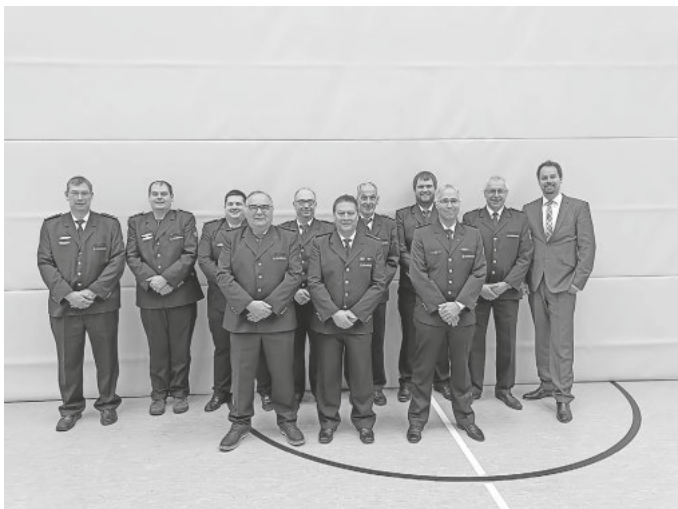
Gesamt Ausschuss FW Schemmerhofen