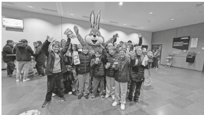
H. Rehwald

Unter dem Motto „Karma strikes back“ zeigt sich, dass sich Ehrenamt in vielerlei Hinsicht lohnt. Die Schülerinnen und Schüler der 7b sind sich sicher: Ihr Einsatz war nicht nur für den guten Zweck wertvoll, sondern hat auch das Gemeinschaftsgefühl gestärkt und einen bleibenden Eindruck hinterlassen.